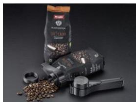
Фото 4: Зажим для пакетов кофе из серии 3D4U позволяет повторно запечатывать упаковку после её вскрытия, чтобы кофе всегда оставался свежим. (Фото: Miele)

Фото 3: Благодаря специальному фильтру-насадке для пылесоса мелкие ценные вещи не попадут в мешок-пылесборник или контейнер для сбора пыли. (Фото: Miele)