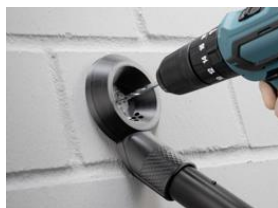
Фото 2: Специальная насадка, собирающая пыль при сверлении отверстий перфоратором, делает рабочий процесс более простым и удобным.