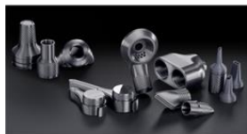
Фото 1: Полезные принадлежности, которые можно распечатать дома на 3D-принтере: Miele представляет проект 3D4U, состоящий из десяти моделей, которые можно превратить в домашние аксессуары.

К пресс-релизу прилагаются пять фотографий: