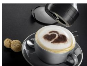
Фото 5: Рисунки для кофейных трафаретов из серии 3D4U с легкостью кастомизируются. (Фото: Miele)

Фото 4: Зажим для пакетов кофе из серии 3D4U позволяет повторно запечатывать упаковку после её вскрытия, чтобы кофе всегда оставался свежим. (Фото: Miele)