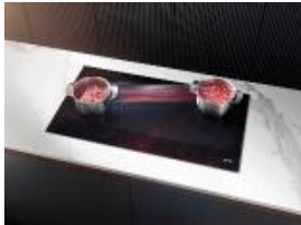
Фото 2: Индукционная панель конфорок KM 7897 FL дополнит современный и минималистичный интерьер вашей кухни.