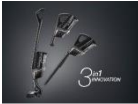
Фото 1: Благодаря инновационной концепции «3 в 1» Triflex HX1 отлично адаптируется под ваши потребности.