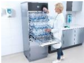
Фото 3: Компактные габариты серии Slim-line и максимальная вместительность: отдельно стоящий автомат для мойки лабораторного стекла Miele Professional примечателен телескопическими направляющими, позволяющими использовать прибор предельно эффективно.

Текст и фото можно скачать на: www.miele-presse.de